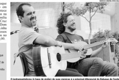
O instrumento é a base de tudo e o principal diferencial do Bataque de Cordas

SERVIÇO: O Bataque de Cordas apresenta suas músicas nessa quinta-feira, 22 de junho na EFASC. O grupo é formado por músicos locais e tem como principal diferencial o fato de serem todos músicos que atuam em Santa Cruz do Sul. O grupo foi formado há sete anos e atua em Santa Cruz do Sul e em outros municípios da região.