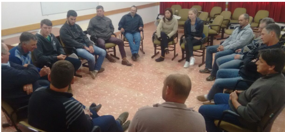
Atual diretoria e Conselho de Administração da AGEFA Gestão 2016-2018

A AGEFA foi fundada no dia 25 de julho de 2008 e é basicamente formada pelos seus Sócios Fundadores, Famílias que têm ou tiveram filhos na EFASC e jovens Egressos/as. A sua diretoria se reúne mensalmente para tratar dos rumos da EFASC, tomar decisões e preparar as Assembleias (que são pelo menos 3 ao ano), onde tudo é definido e a prestação de contas é realizada. Assim, a AGEFA é a responsável pela articulação de toda a rede institucional da escola e responde legalmente pela EFASC, reafirmando que a Escola Família Agrícola de Santa Cruz do Sul é antes mesmo de ser escola, composta por uma associação de famílias.