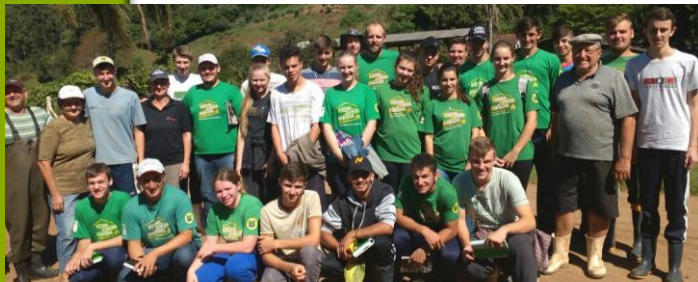
Família Müller – Santa Cruz do Sul

As Visitas de Estudos permitem aos Estudantes e Monitores o contato com outros espaços formativos e educativos, qualificando ainda mais a sua formação através da vivência de outras realidades, via Agricultores/as Familiares, entidades, feiras e exposições.