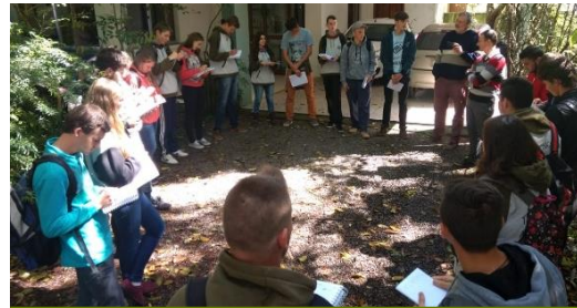
CAPA – ECOVALE