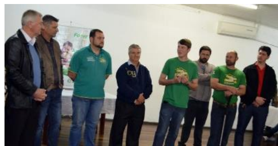
Ato formalização convênio SICREDI - AGEFA