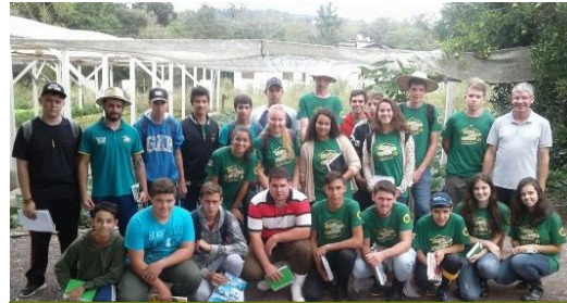
Mudas Back – Vera Cruz