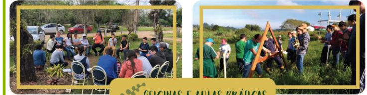
OFICINAS E AULAS PRÁTICAS