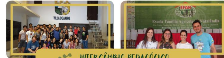
INTERCÂMBIO PEDAGÓGICO LATINO-AMERICANO (IPLA)