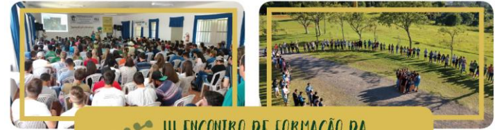
III ENCONTRO DE FORMAÇÃO DA JUVENTUDE DA AGRICULTURA FAMILIAR