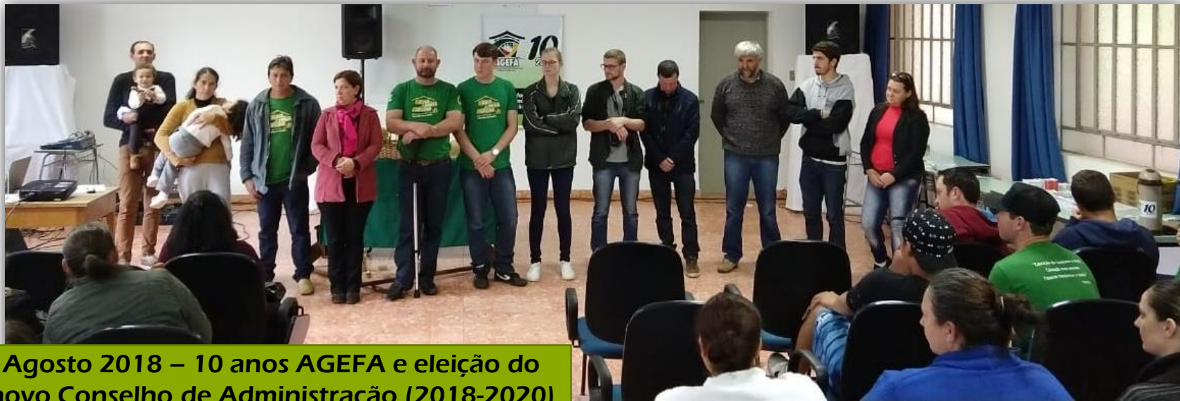
Agosto 2018 – 10 anos AGEFA e eleição do novo Conselho de Administração (2018-2020)