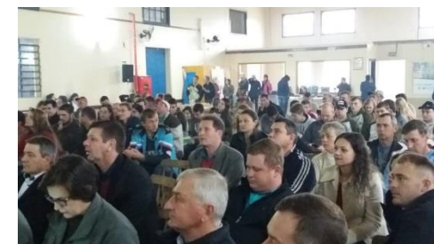
Seminário Regional do Cooperativismo na Agricultura Familiar