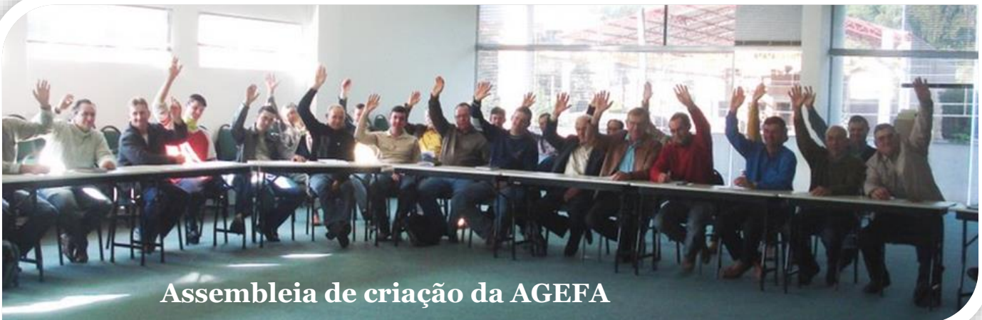
Assembleia de criação da AGEFA

A Escola Família Agrícola de Santa Cruz do Sul - EFASC foi inaugurada no dia 1º de março de 2009, graças ao intenso trabalho de mobilização popular e de diversas articulações institucionais. Construída por várias mãos, nasce assim a primeira Escola Família Agrícola do sul do Brasil. O primeiro ato de constituição ocorreu com a criação da AGEFA - Associação Gaúcha Pró-Escolas Famílias Agrícolas, no dia 25 de julho de 2008. A AGEFA é uma associação sem fins lucrativos que, além de ser a representação a nível estadual, é filiada à UNEFAB - União Nacional das Escolas Famílias Agrícolas do Brasil. É também a mantenedora da EFASC, respondendo integralmente pela sua gestão.