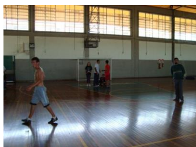
Uso do complexo esportivo na UNISC, com o acesso a ginásio poliesportivo, pista de corrida e várias quadras de esporte.