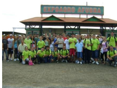
Participação na EXPOAGRO AFUBRA, a maior feira da Agricultura Familiar.