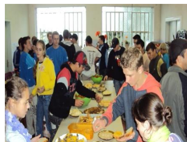
Momento de degustação de uma mesa farta com produtos orgânicos.