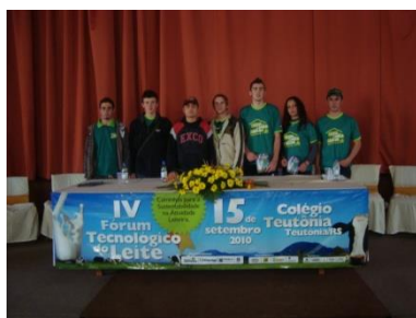
Participação do IV Fórum Tecnológico do Leite em Teutônia.