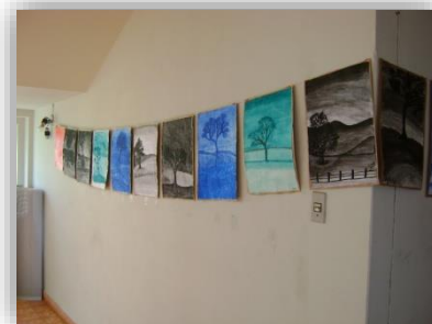
Espaço de demonstração dos trabalhos e obras de arte.