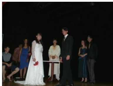
Aulas de teatro