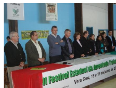
Participação do II Festival Estadual da Juventude Rural – FETAG em Vera Cruz.