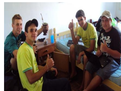
O internato serve como espaço de convivência e aprendizado.