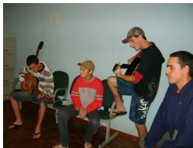
Aulas de música