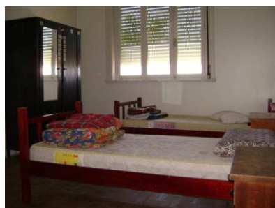
Internato com refeitório, dormitórios femininos e masculinos, sala de televisão e de estudos, entre outros.