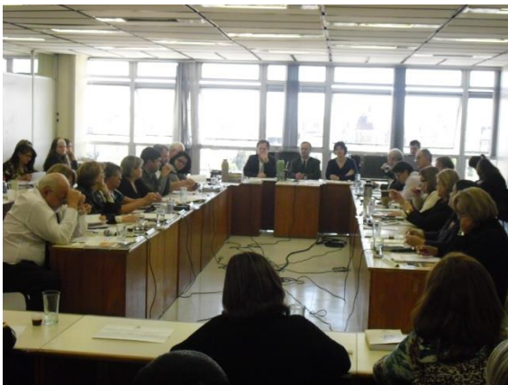
Ato de votação e aprovação do credenciamento e autorização de funcionamento do Curso Técnico.