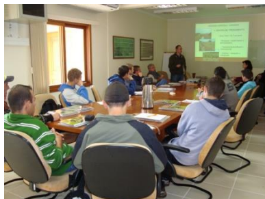
Visita ao Centro de Treinamento da Alliance One, em Passo do Sobrado.