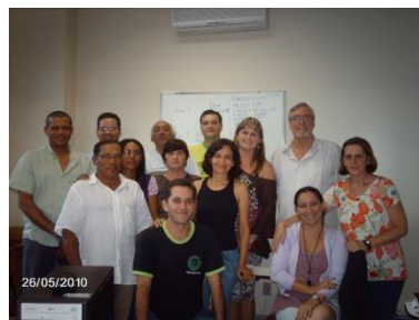
Equipe da EPN, oriunda de diversos Estados Brasileiros para discutir a Pedagogia da Alternância nas EFA's.