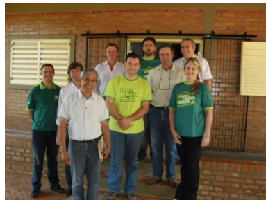
Reunião na sede da UNEFAM, com os membros da coordenação.