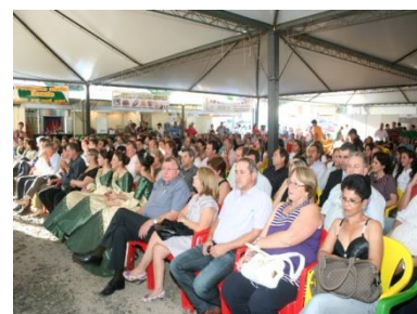
Banca na EXPOBOL, no Município de Boqueirão do Leão.