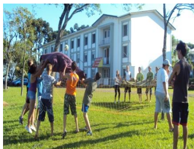
Momentos de integração das turmas.