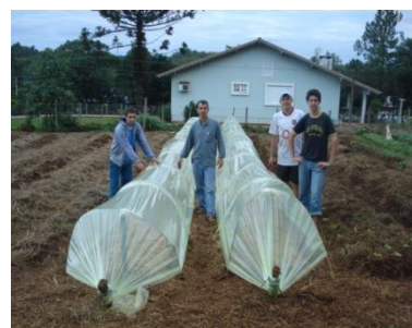
Construção e manejo de estufas de túnel baixo.