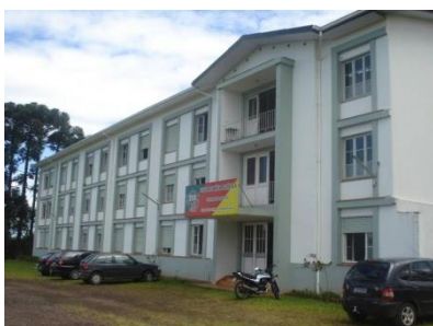
Vista geral do prédio onde é a sede da EFASC, junto ao Seminário São João Batista, em Linha Santa Cruz.