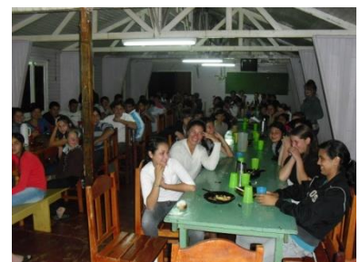
Conversa com os Jovens da EFA de San Vicente.