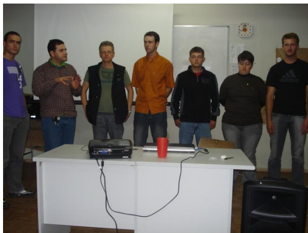
Apresentação dos jovens da região que participaram do intercâmbio recentemente.