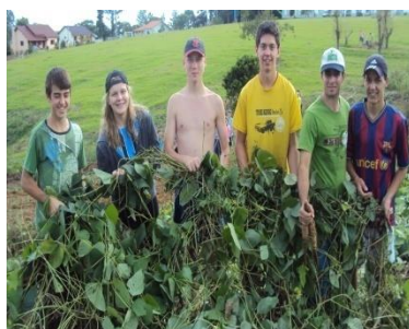
Cultivo e manejo da adubação verde de verão.