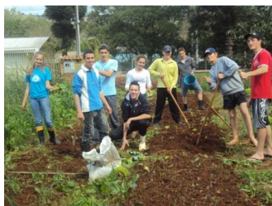
Preparo de canteiros e a produção de hortaliças ecológicas para serem utilizadas na alimentação dos jovens na EFASC.