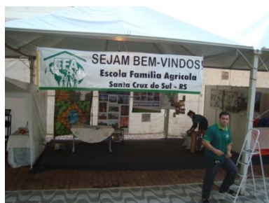
Banca na 8 a EXPOSIN, no Município de Sinimbu – RS.