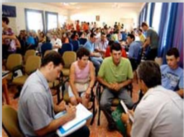
Processo de seleção dos primeiros 50 estudantes a ingressarem na EFASC.