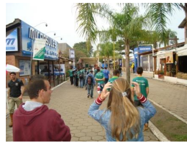
Participação na EXPOINTER em Esteio.