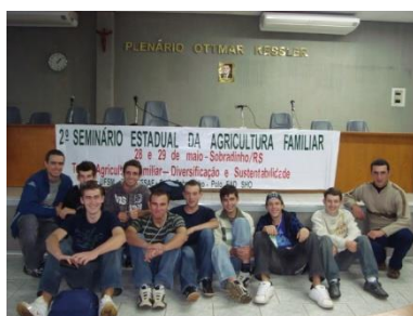
Participação do II Seminário Estadual da Agricultura Familiar em Sobradinho.