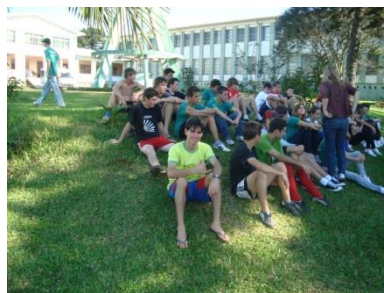
Momentos de integração das turmas.