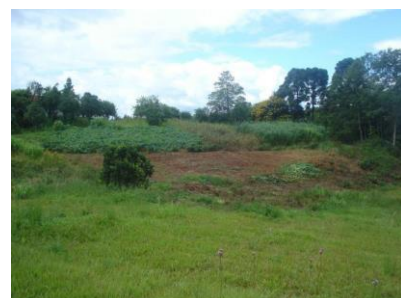
Área experimental para a realização de práticas agrícolas e para a produção de alimentos orgânicos.