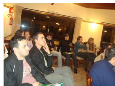
Participação da Semana do Empreendedor.