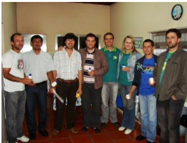
Visita à EFA de El Soberbio, conversa e diálogo com Monitores.