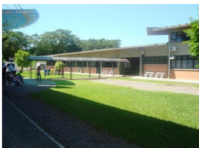
Bloco 51 da Engenharia Agrícola, onde ocorrem as aulas e o uso de diversos laboratórios da área agrícola.