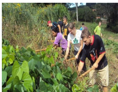
Cultivo e manejo da adubação verde de verão.