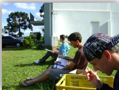
Aplicação de técnicas de desenho.