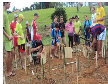
Construção do espiral de ervas medicinais.