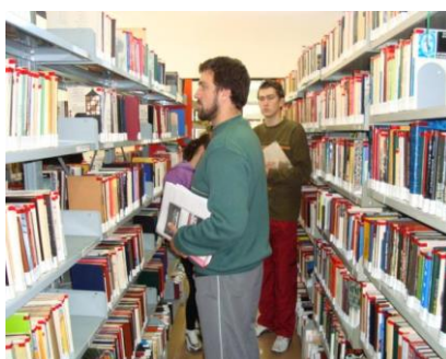
Acesso a todos os recursos da biblioteca da UNISC com mais de 300.000 livros à disposição.