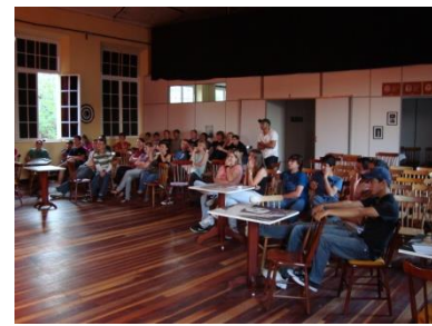
Teatro no Espaço Camarim.