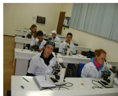
Aulas em diversos laboratórios de todas as áreas das ciências naturais.