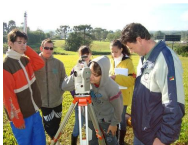
Mapeamento e levantamento de medidas com teodolito.