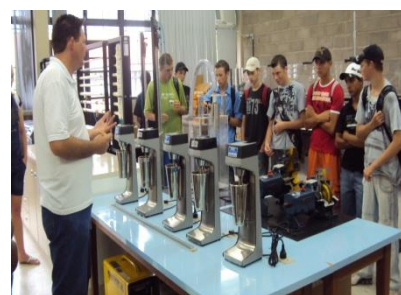
Laboratório de agrohidrologia; no total são 6 laboratórios todos voltados à área agrícola, além da área experimental.