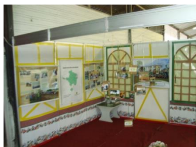
Banca na 26 a Oktoberfest e Feirasul em Santa Cruz do Sul - RS