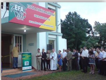
Ato de inauguração, com o início das atividades letivas em 2009.

A Escola Família Agrícola de Santa Cruz do Sul - EFASC foi inaugurada no dia 1º de março de 2009, graças ao intenso trabalho de mobilização popular e de diversas articulações institucionais. Construída por várias mãos, nasce assim a primeira Escola Família Agrícola do sul do Brasil. O primeiro ato de constituição ocorreu com a criação da AGEFA - Associação Gaúcha Pró-Escolas Famílias Agrícolas, no dia 25 de julho de 2008. A AGEFA é uma associação sem fins lucrativos que, além de ser a representação a nível estadual, é filiada à UNEFAB - União Nacional das Escolas Famílias Agrícolas do Brasil. É também a mantenedora da EFASC, respondendo integralmente pela sua gestão.