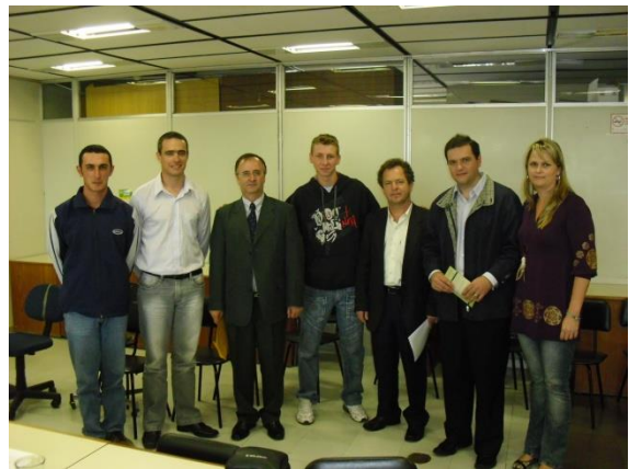
Equipe de Monitores e Jovens da EFASC com o Presidente do Conselho e o relator do processo.