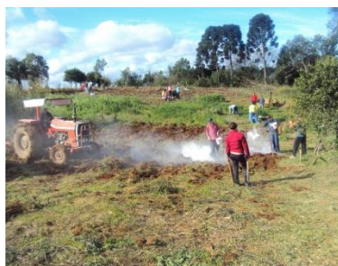
Preparo e correção da área experimental.