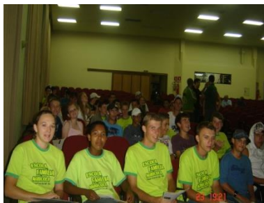
Participação da Assembleia Geral do SICREDI Vale do Rio Pardo.