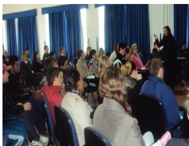
Um momento para discutir a importância da produção e alimentação com produtos orgânicos.