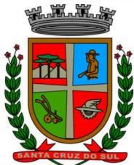
Santa Cruz do Sul