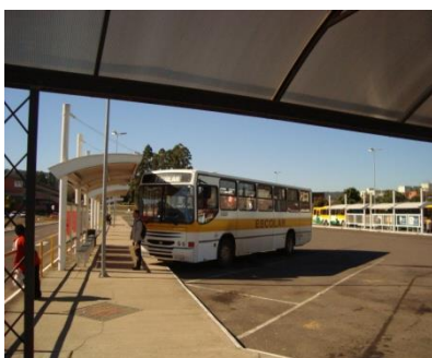
Ônibus cedido pela Sec. De Educação de Santa Cruz do Sul que realiza o traslado.

A EFASC disponibiliza a sua formação em dois espaços: na UNISC pela manhã , junto ao bloco 51 (Engenharia Agrícola), tendo à disposição, salas de aula, laboratórios, tanto na área agrícola como para o Ensino Médio, biblioteca e complexo esportivo. Nos outros períodos, as atividades ocorrem junto ao Seminário São João Batista , em Linha Santa Cruz, onde se dispõe de toda a infraestrutura de internato, refeitório, salas de aula e área agrícola experimental.