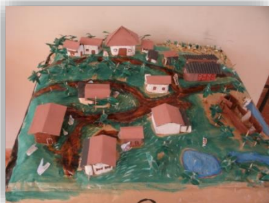
Elaboração de maquete das propriedades