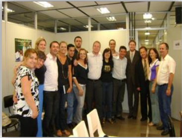
Credenciamento e autorização de funcionamento pelo Conselho Estadual de Educação – CEED/RS