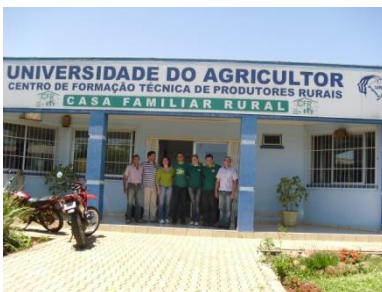
Reunião com coordenação da CFR e com o Presidente da ARCAFAR RS, para futuros intercâmbios.